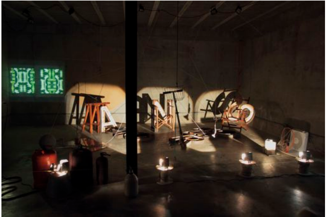
Pere Noguera Entrada de Fosc. Cap Explicació. Accions en repòs 2014