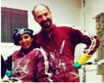
Estudi Tonic Disseny gràfic. (La Bisbal , Girona) . Maig Disseny gràfic (Intercanvi)