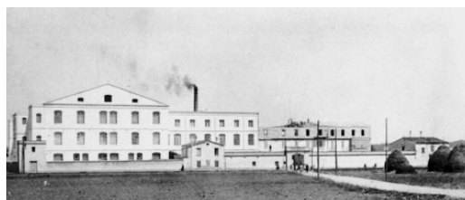
Salt, Gérone, Espagne, Usine de textile Coma Cros

Arreu del món hi ha llocs que per les seves característiques històriques i pel compromís de la societat amb la memòria esdevenen espais de patrimoni i cultura.