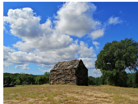
Walden Gavarres. 2019. Cassà de la Selva.