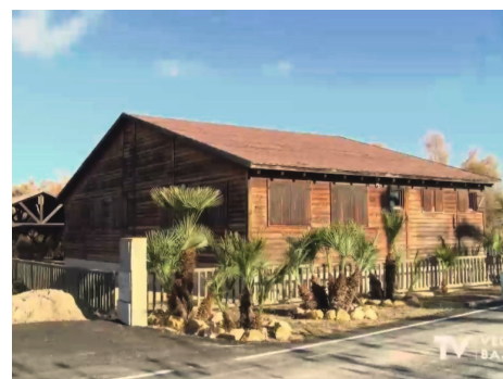
Aula de Naturaleza de Catral (Alacant).

Finalment establim que la residència serà del 16 al 27 d'octubre , adaptant-se a unes dates que em faciliten el permís laboral que hauré de demanar. La meua estada serà de dilluns a divendres en una casa rural de Catral i el cap de setmana del mig en Fred el reubicarà al no poder disposar del mateix lloc.